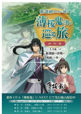
企画パンフレット（函館編）

「ORIX HOTELS & RESORTS」ブランドの「函館・湯の川温泉 ホテル万惣（ばんそう）」「会津・東山温泉 御宿 東鳳（おんやど とうほう）」「クロスホテル京都」は、2022年3月19日（土）～6月30日（木）の期間、新選組ゆかりの地をオリジナル・ビデオ・アニメーション（OVA）の「薄桜鬼（はくおうき）※」の隊士3人と共に巡る宿泊プラン「いざ出陣！新選組再発見の旅プラン」の販売を開始し、本日より各施設の公式ウェブサイトにて予約受付をします。