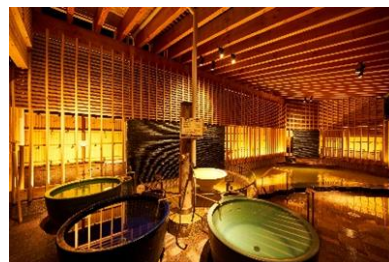
ホテル万惣 壺湯・露天風呂

北の大地と海の幸、函館の食文化を余すところなく愉しむ季節ごとのごちそうも贅の限りに。函館という街の世界観と食を思う存分味わえる、北国ロマンの旅へお越しくください。