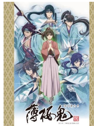
OVA「薄桜鬼」 オリジナル文庫本型メモ帳