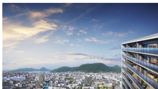
高松市内の眺望（イメージ）

本物件は、上之町エリア内で「サーパス上之町ミッドレジデンス」※に続く2棟目となります。ことでん琴平線「三条駅」徒歩7分、中央通りや塩江街道の幹線道路に囲まれた立地で、市内・郊外へのアクセスが快適です。周辺には、「紫雲山」や特別名勝の「栗林公園」がある落ち着いた住宅街でありながら、県内最大のショッピングモール「ゆめタウン高松」やクリニックなど、生活利便施設が充実しています。