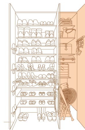
アドレスエントクローク (イメージ)

また、リビングに面している部屋は、2枚引き戸を採用し、用途に応じて一つの部屋のように開放的にご利用いただけます。