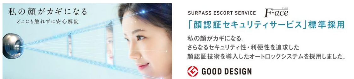
サーパスエスコートサービス+F-face (イメージ)

顔認証技術を導入したセキュリティサービス「サーパスエスコートサービス+F-face」を標準採用しています。また、ご家族が帰宅した時や宅配ボックスに荷物が預けられた際には、指定のメールアドレスにメールが配信されます。不在時に訪問者があった際は、訪問者の顔写真付きのメールが配信されるなど、最新のテクノロジーにより安心・便利なライフスタイルをお届けします。