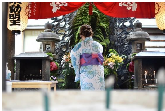
周辺散策イメージ（法善寺）

クロスホテル大阪のあるミナミエリアには、水掛不動尊で有名な法善寺や道頓堀商店街など散策できるところがたくさんあります。大阪の風情あるスポットをご友人同士やカップル、ご夫婦など一緒に浴衣を着て、ホテル周辺の観光や散策を満喫いただけるよう 2022年7月22日（金）～9月16日（金）の期間限定のプランとして企画しました。