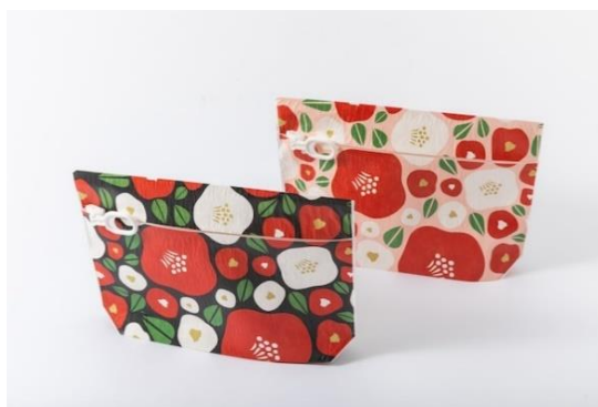
センタースライダーポーチ