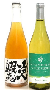
「スパークリングワイン」 イメージ

※2 乾杯タイムは17:00、18:00、19:00を予定していますが、状況により変更になる可能性があります。