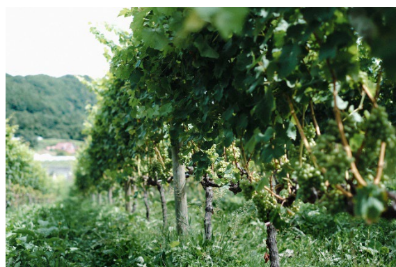
ワインブドウ畑（イメージ）

北海道のワインは近年の気候変動や技術向上に伴い、年々ワイナリー数が増加し、醸造所の軒数は山梨県、長野県に次いで第三位、ワイン専用品種の作付面積は第一位と規模が拡大し、全国的にも注目を集めています*。この北海道産ワインを、外食シーンだけではなく、ホテルや自宅でも気軽に楽しんでいただき、北海道産ワインのさらなる消費拡大を図るために「北海道の日本ワインで乾杯」をテーマに、北海道の日本ワインを楽しむスパークリングワインデーを企画しました。9月と12月にそれぞれ3日間ずつ「スパークリングワインデー」を設定し、クロスホテル札幌および札幌市内ワインショップで、ワインエキスパートのおすすめ北海道スパークリングワインの紹介やトークイベントなどを実施します。クロスホテル札幌では、期間中のご宿泊のお客さまにスパークリングワインの試飲をご用意するほか、北海道産ワインをセットにした宿泊プラン販売などを行います。