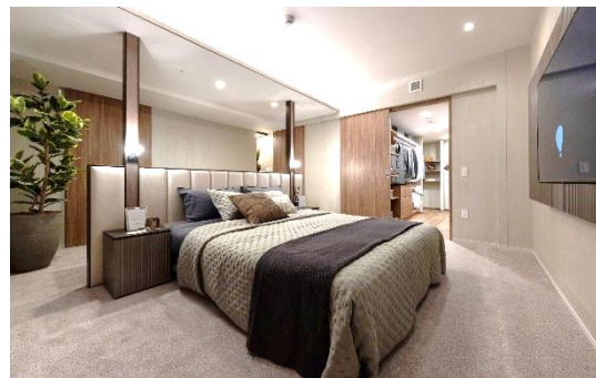
ウェストタワー ベッドルーム（モデルルーム）