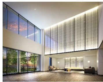
ウエストタワーエントランス（イメージ）

本物件は、ウエストタワー、イーストタワーの 2 棟で構成される北海道最高層のツインタワー型分譲マンション ※1 で、同じ開発区画内には都市公園・商業施設・ホテルなどの開業も予定されています。JR 函館本線「札幌」駅、札幌市東豊線・南北線「さっぽろ」駅から徒歩 6 分 ※2 、さらに 2030 年度末までの開業を目指す北海道新幹線「札幌」駅の改札にも至近となる予定 ※3 です。