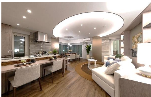
ウェストタワー リビングダイニング（モデルルーム）

間取りは、ウェストタワー、イーストタワーともに1LDK～4LDK（専有面積42.71㎡～121.30㎡）で、全44タイプをご用意しました。各棟20階に入居者専用の「スカイラウンジ」を設置したほか、内廊下設計を採用し、ホテルライクな生活を実現します。