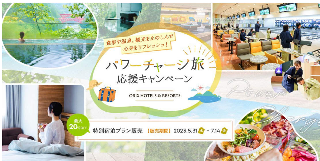
キャンペーンイメージ

特設ページ： https://www.orixhotelsandresorts.com/feature/123591/