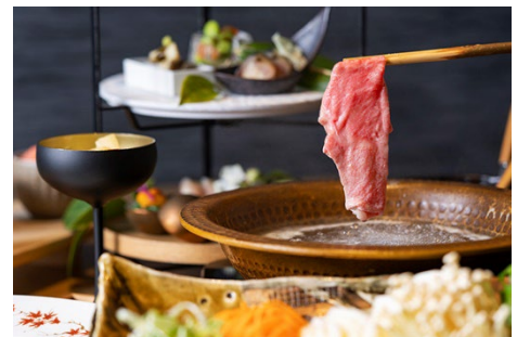
選べる鍋で口福なひとときを

各地の旬の味覚や地元の食材、地酒などを堪能してパワーチャージを。そのほか、うなぎや国産黒毛和牛などスタミナ満点のお食事が楽しめる特別ランチコース付きのプランなど、食へこだわりたい方へぴったりのプランです。