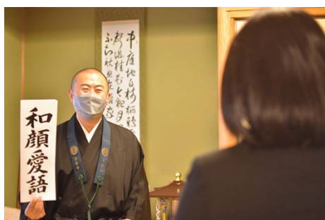
ご住職の法話でしっとりと

自然散策や観光はもちろん、ご住職の法話を拝聴したり、滝行に挑戦したり、御朱印集めをしながら伝統工芸にふれたり。施設の外に出て、アクティブに過ごす旅をご提案。旅先ならではの体験を通じて、知的好奇心も刺激します。