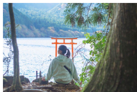
芦ノ湖畔や箱根の森を散策