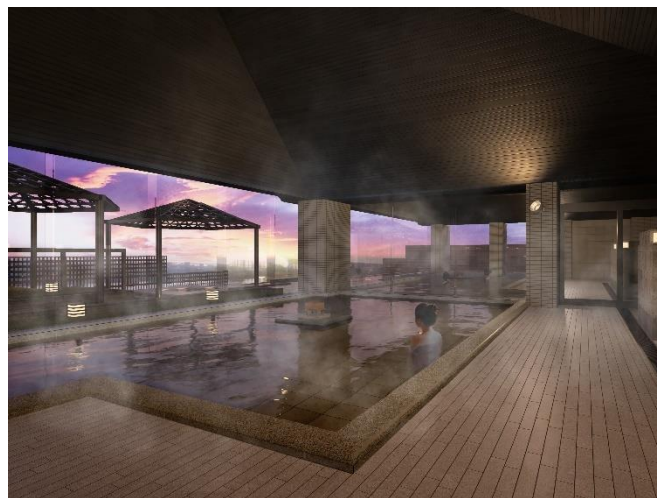
リニューアル後の大展望露天風呂「棚湯」イメージ

杉乃井ホテルでは、現在大規模リニューアルプロジェクトを進めており、2021年7月にカジュアル棟「虹館」、2023年1月にフラッグシップ棟「宙館」を開業し、2025年1月には最終棟となる「星館」の開業を予定しています。このたび、杉乃井パレスに位置する「棚湯」を20年ぶりにリニューアルし、“五感で味わう別府体験”をテーマに、温泉湧出量全国一位※の別府に根付く杉乃井ホテルらしいエンターテインメント性ある温泉体験をお届けします。