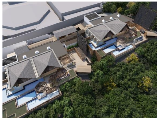
大展望露天風呂「棚湯」全体イメージ