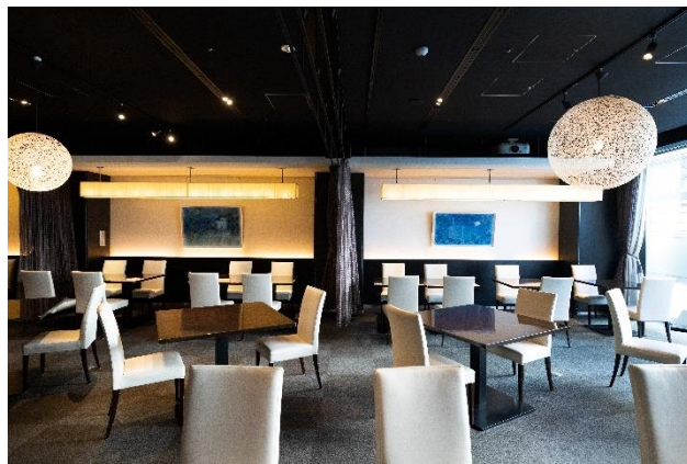
レストラン店内（過去作品）