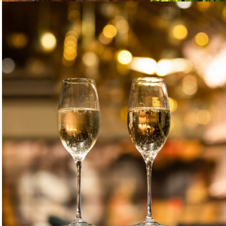
写真上：思わずかぶりつきたくなる肉厚なトマホーク、写真下：スパークリングワインで乾杯！※写真はイメージです