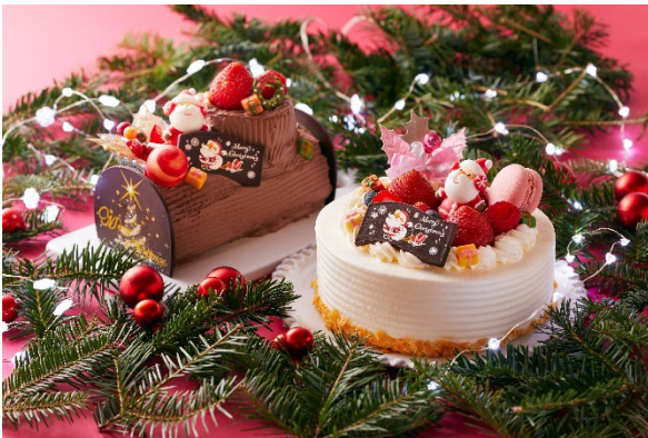
選べる2種のクリスマスケーキ(イメージ)