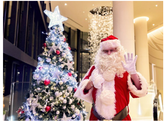
サンタがお部屋にやってくる！（イメージ）

1日12室限定の“サンタに会えるプラン”。ポートでは12月22日（金）、24日（日）、ヴィータでは23日（土）、25日（月）に、事前にホテルにお預けいただいたクリスマスプレゼントなどを、サンタクロースがお部屋にお届けします。お子さまや恋人など、大好きな人の笑顔に出会える、幸せにあふれるクリスマスをサプライズで演出します。