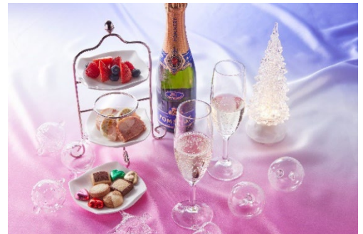
シャンパン&オードブル付き宿泊プラン (イメージ)

【メニュー】 オードブル&デザート 7 種とシャンパン 1 本 (2 名利用時はハーフボトル、3~4 名利用時はフルボトル)