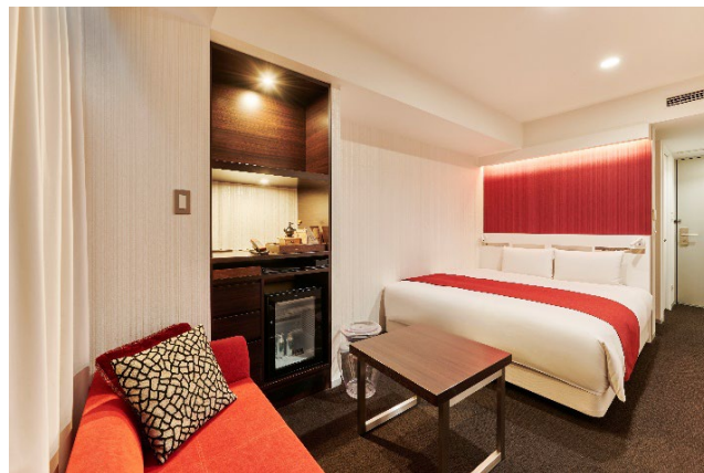
クロスフロアダブルルーム（ヒップスタイル）

クロスホテル札幌では14階から17階（18階建て）の高層階を「クロスフロア」として、豆から挽くコーヒーセットや、北海道のお菓子などの特別なおもてなしをご用意しております。11月1日からは、地域を感じるドリンクやフードをフリーフロースタイルでお楽しみいただけるラウンジ「meetlounge」がスタートし、より充実したホテルステイをご提供いたします。