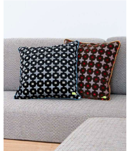
クッション (イメージ)

北海道札幌市生まれ。多摩美術大学デザイン学部染色科を卒業後、株式会社イッセイミヤケテキスタイル企画に入社。退職後渡英し、英国の王立芸術大学院、RCA Fashion & Textile courseにて修士課程を修了する。在学中に、グアテマラの織物工場の製品をイギリスの市場に繋げるといったディレクターの仕事に従事し、「デザインとは人や社会を繋ぎ未来の架け橋になる職業である」ことを実感しやりがいを見出す。また、欧州新人登竜門のデザインコンペTEXPRINT2005にてグランプリを受賞し、フリーランステキスタイルデザイナーとして海外で活動する道が拓けた。卒業後、今後の方向性を探る中で日本の繊維市場が厳しくなることを見越し、日本の産地立て直しに貢献したいという思いから帰国。2006年に株式会社KAJIHARA DESIGN STUDIOを設立し、日本繊維産地の未来づくりに貢献することを目標にグローバル販路の開拓、トレンドマーケティング、地方活性化に向けた新規事業ブランディングに携わる。札幌南区芸術の森近くにショップ、レストラン、ゲストハウスがある複合施設「COQ」を立ち上げ、自然と共に過ごす暮らしのバランスを衣食住やアートから発信中。