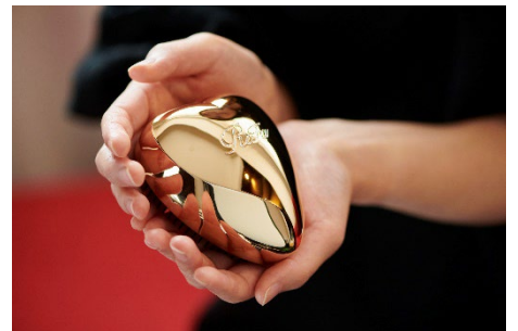
リファハートブラシ (イメージ)

プラン予約：「クロスホテル札幌」公式ウェブサイト https://www.crosshotel.com/sapporo/