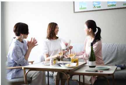
滞在中サプライズがあふれるステイプラン（クロスホテル札幌）

詳細： https://cross-sapporo.orixhotelsandresorts.com/wcrsppop/plan/7046/