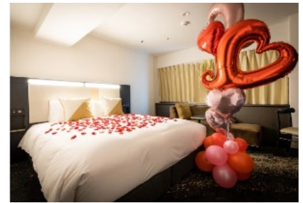
バルーンとベッドデコレーションでサプライズ演出（クロスホテル大阪）