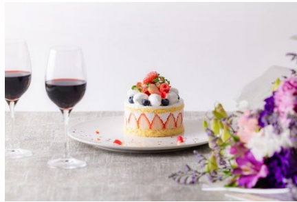
アニバーサリーや花束、ワインをお部屋にご用意（クロスホテル京都）