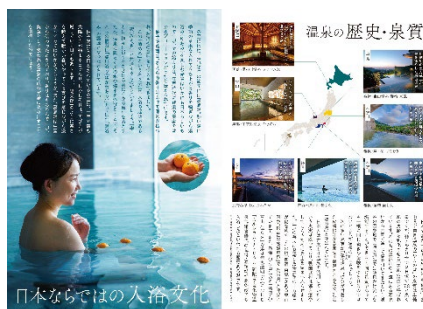
温泉サウナ BOOK では温泉の歴史もご紹介