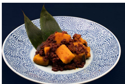
冬至かぼちゃ（御宿 東鳳）

かぼちゃメニューのほかにも、メニュー名の中に「ん」がつくメニューを探して来年にむけて運を付けよう！ビュッフェでワイワイとお食事しながら、皆さままでお好みの「ん」がつくメニューを見つけてください。