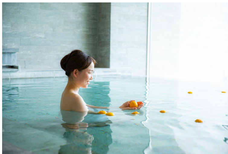
広々とした浴槽で「ゆず湯」を楽しむ（イメージ）

特集ページ： https://www.orixhotelsandresorts.com/feature/148238/