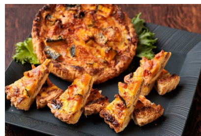
かぼちゃのキッシュ（杉乃井ホテル）