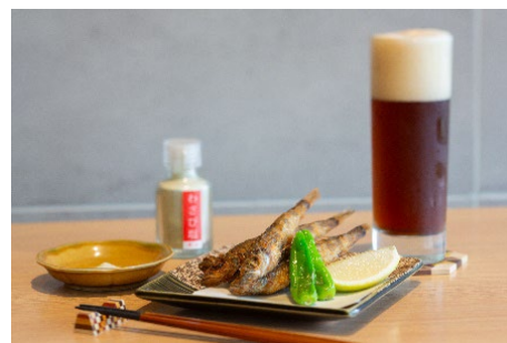
湯上りは九頭龍生ビールで乾杯！プラン限定おつまみ付プラン(箱根・芦ノ湖 はなをり)