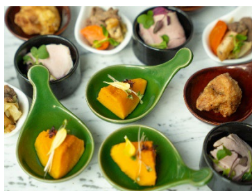
北海道かぼちゃを使用（クロスホテル札幌）