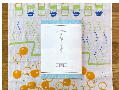
手ぬぐい&温泉サウナ BOOK