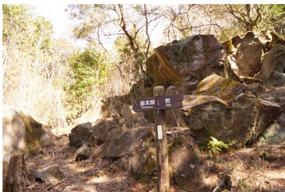
金太郎伝説が残る「金太郎岩」

また、館内で体験できるイベントとして、江戸時代の旅人が箱根山を越えるために履いたわらじを、ミニチュアで作るワークショップも実施いたします。