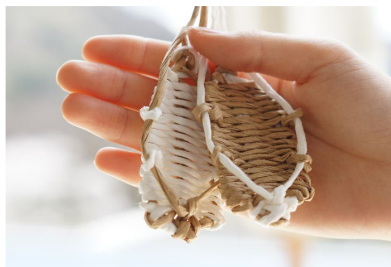
紙ひもで作るミニわらじ

端午の節句（こどもの日）に飾る五月人形（こけのぼり）の金太郎には、こどもが金太郎のように健やかに育つようにという願いが込められています。箱根は童謡「金太郎」にも歌われる足柄山をはじめ、金太郎の伝説が残る土地です。はなをりでは、こどもの日に箱根を訪れるご家族をターゲットに、桃源台から徒歩でアクセスできる知られざる金太郎伝説のスポット「金太郎岩」までの散策イベントを実施いたします。5月の緑豊かな自然の中、昔話の舞台を訪ね、親子の会話に花咲くひとときをお楽しみください。