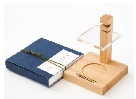
INCENSE KITCHEN オリジナル香炉・銀葉。写真はイメージです。

【予約】公式ウェブサイト www.crosshotel.com/kyoto/ | TEL 075-231-8831（宿泊予約直通）