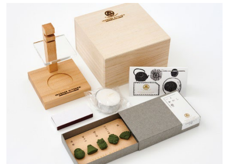
スターターコフレは旅の思い出はもちろん、お土産にもおすすめ。写真はイメージです。