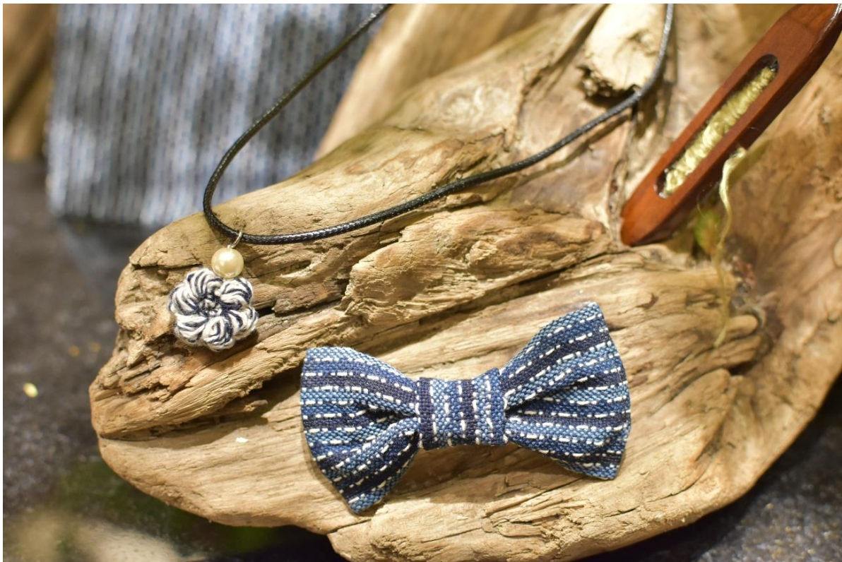
藍の深みを纏う、みくりや染織のアクセサリー。日常に上質な彩りを。

天然阿波藍による深く上品な“ジャパンプルー”を現代の暮らしに取り入れられるよう、ストール、ハンカチ、アクセサリーなど幅広く展開します。