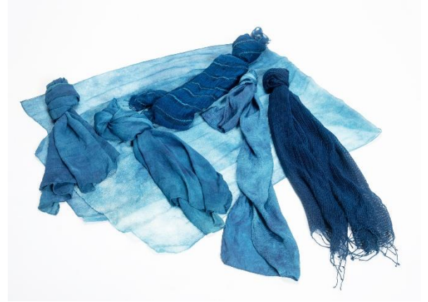
冬の装いに、藍の彩りを。