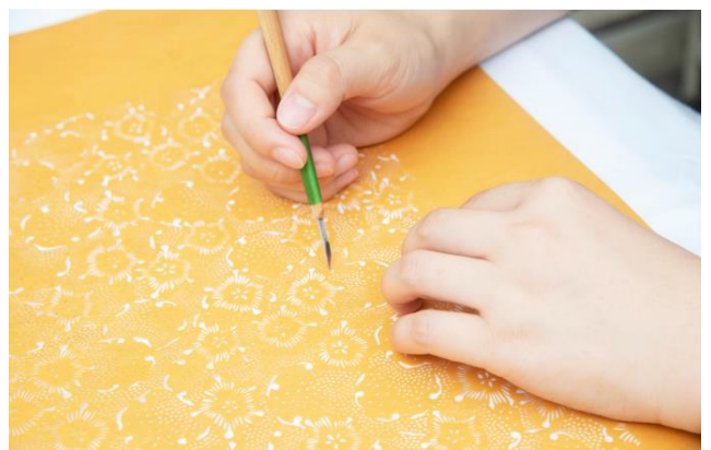
小原屋初代から伝わる伝統の型紙の彫り直し作業。