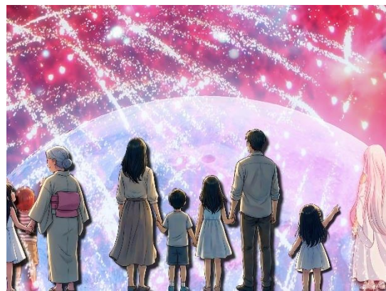
宙で大切な思い出を振り返るシーン（イメージ）