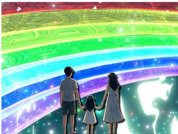
水中の虹が天へ伸び、記憶へ導くシーン（イメージ）

虹を渡り、星を巡り、宇宙を越えて。少女の旅は、あなた自身の心と重なります。家族や友と笑った時間、そのひとつひとつが人生を彩る宝物。観終わったあと、心に温かな微笑みが灯る物語が、今はじまります。今回の作品は主人公である少女を中心に、虹、星、宙それぞれの思い出をたどりながら、大切な誰かと一緒に過ごした杉乃井ホテルでの幸せな時間を、いつまでも覚えていて欲しい。そんな願いを込めて作りました。