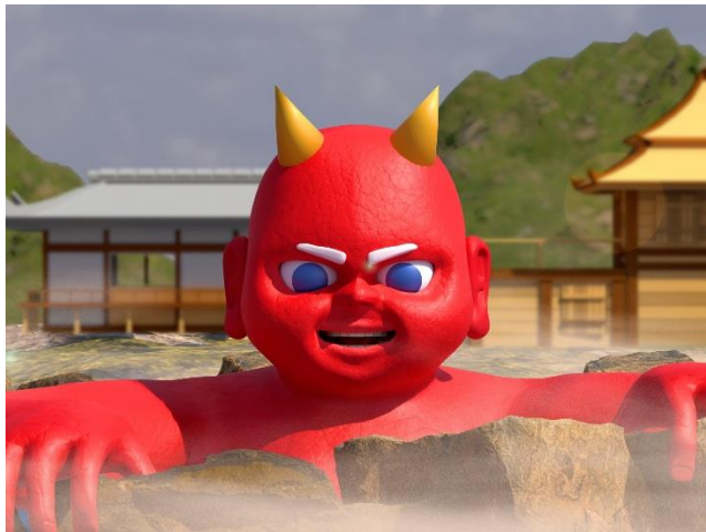
鬼の里・温泉のシーン（イメージ）

別府の温泉や自然、鬼伝承をテーマに、杉乃井ホテルと学生が共に練り上げたプロジェクションマッピング作品です。オリジナルキャラクター「ゆげまる」の案内により、鬼が守護の存在へと変わっていく物語が、建物の立体感と重なり合いながら 3DCG で描かれています。学生たちは声優にも挑戦し、ヒアリングや映像表現の試行錯誤を重ねた創意工夫が、地域の魅力を温かく楽しく伝える作品となっています。