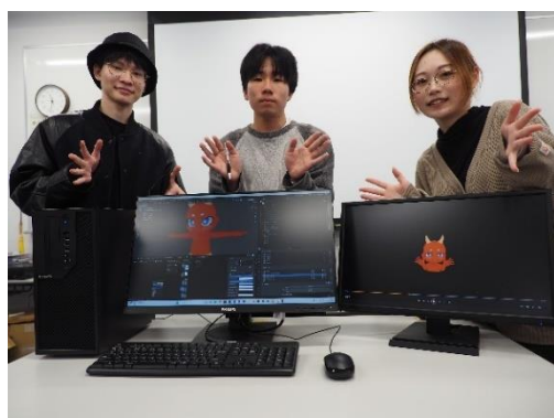
制作に携わった学生