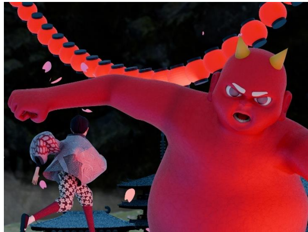
鬼と一寸法師のバトルシーン（イメージ）