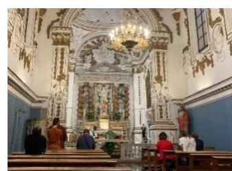
フィンランド、イタリア滞在中の実際のモチーフ写真