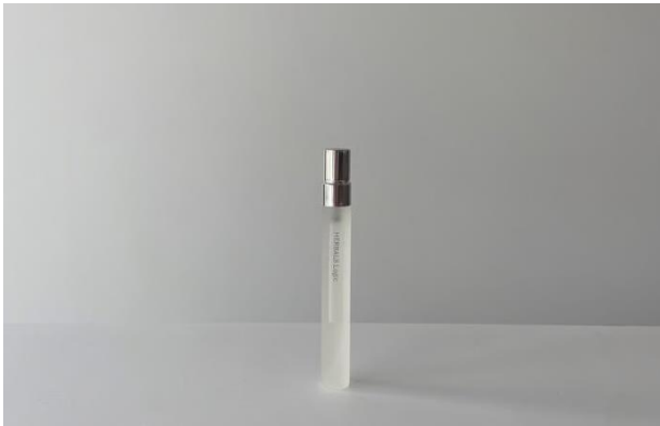
販売しているフレグランスミスト