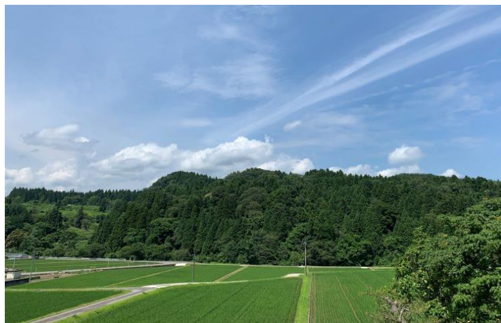
爽やかな風が吹き抜ける、紫蘇と薄荷が育つ風景