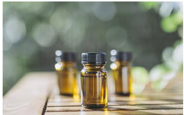
フレグランスのイメージ