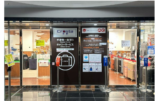
写真：JR京都駅にあるCrosta京都