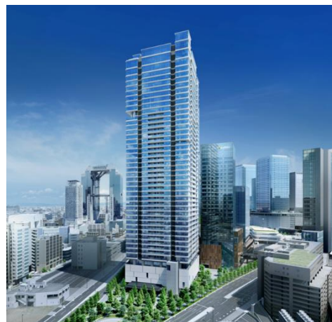
自然と都市機能が調和するグラングリーン大阪の「南街区」に立地 イメージ