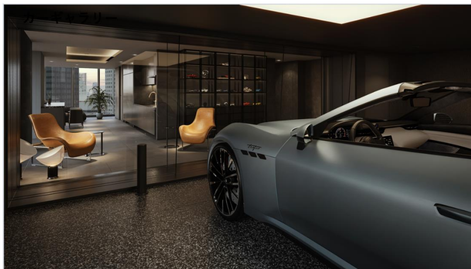
カーギャラリー付き住戸 イメージ