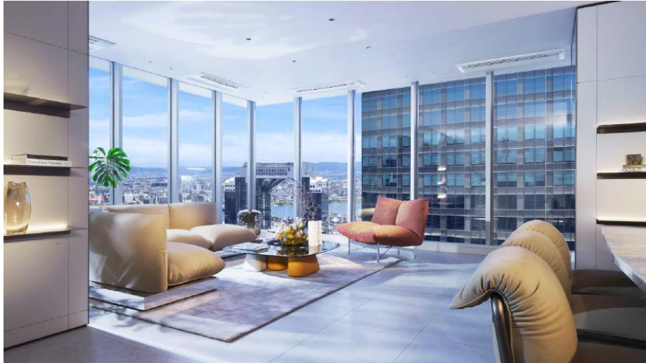
フルハイトサッシを全面窓に使用した高層階の居室 イメージ

当レジデンスの設計コンセプトは「THE SUITE 空と対話する」です。より軽やかに、より開放的に、空とのつながりを感じる住まいを目指しました。その象徴となるのが、新たに開発した床から天井まで届くフルハイトサッシです。当レジデンスでは、全面窓を多用したデザインに加え、このフルハイトサッシを採用することで、室内と外の境界をできる限り薄くし、視界の広がりを最大限に生かし、日々の暮らしを、どこかスイートルームのような特別な体験へと引き上げます。