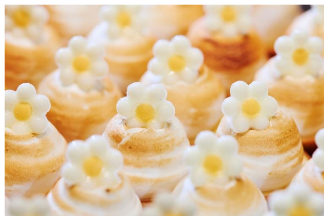
スイーツ タルトシトロン