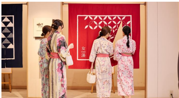
色浴衣で大浴場へ