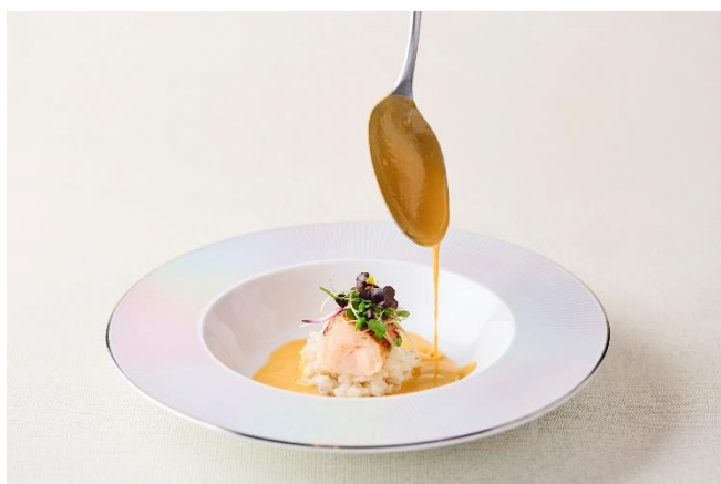
濃厚な旨みを楽しめる