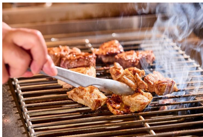
サテ（仔羊・美味鶏）