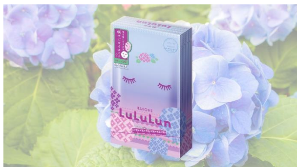
箱根ルルルン アジサイ イメージ

本プランでは、ご当地フェイスマスク「箱根ルルルン アジサイ」を、1名につき1枚ご用意。箱根登山電車の女性社員の方々が軌道内で丁寧に摘んだアジサイのやさしい香りと、うるおい肌を実感していただき、箱根での癒やしのひとときをお楽しみください。温泉でほぐれた肌にフェイスマスクをのせ、客室でゆったりと過ごす時間は、日常から少し距離を置き、自分自身をいたわるための静かな美容時間です。温泉×美容×美味しいお食事、夏を迎える前の肌と心をやさしく整える滞在を提案します。