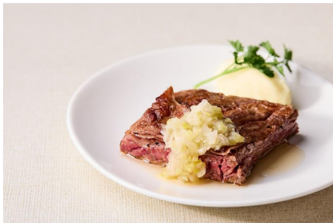
牛ハラミのグリル 葱塩ソース