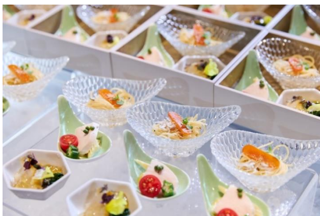
季のしずく（イメージ）