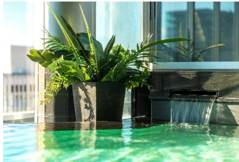
札幌の街並みを眺めながら、ゆったりと おくつろぎいただける最上階大浴場（イメージ）