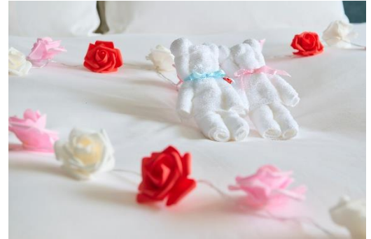
スタッフが心を込めて作るタオルベア（イメージ）