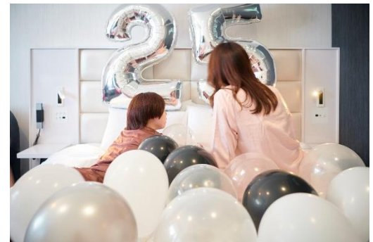
バルーンデコレーションルーム （イメージ）

【宿泊期間】 2026 年 7 月 1 日（水）～2027 年 2 月 28 日（日）