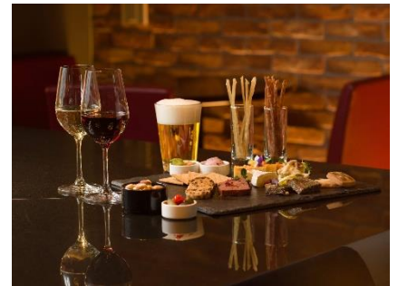
北海道のおつまみやドリンクでより充 実した滞在にする宿泊者ラウンジ。 （イメージ）