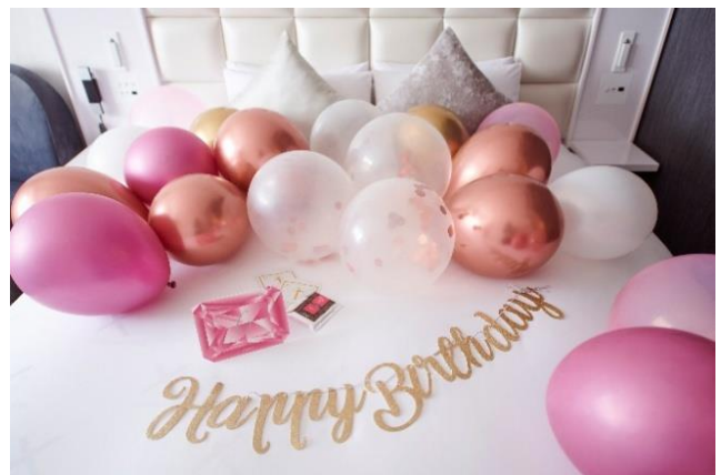
バルーンデコレーションルーム（イメージ）

クロスホテル札幌では、プロポーズや結婚記念日、誕生日など人生の大切な節目をはじめ、目標達成や新たな一歩を踏み出すタイミングなど、お客さまそれぞれの「記念日」に寄り添うサービスを提供しております。昨年度は、約 1,400 組※のお祝いのお手伝いをさせていただきました。