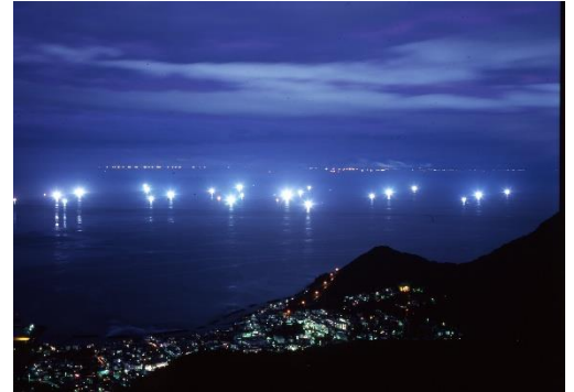
函館山(漁火公園)からの漁火

“食べる”だけで終わらず、実際に海の営みや地域文化へとつながっていく——。朝獲れイカの味覚と、夜の海に広がる幻想的な漁火を通じて、函館の食文化を五感で感じていただけます。