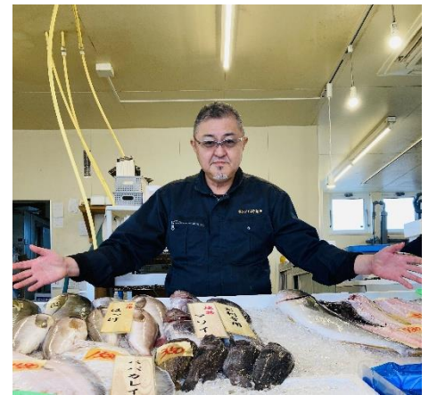
株式会社カネフト川村鮮魚店

公式サイト： http://www.kanefuto.com/company.html