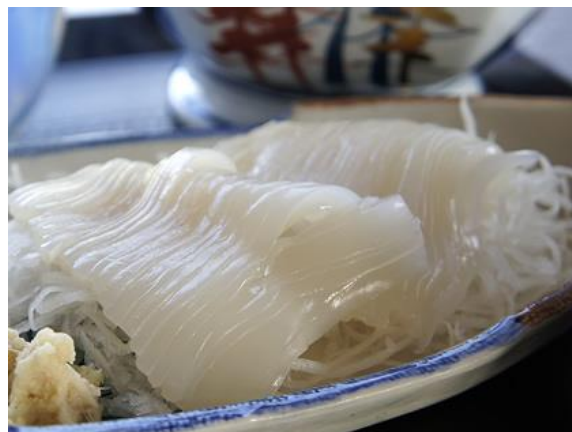
イカ刺し（イメージ）

本サービスでは、地元鮮魚店と提携し、当日朝に水揚げされた新鮮なイカを使用し、素材本来の甘みと食感を活かした状態でご提供します。お客さまにチェックイン時にご注文いただくことで、当日の朝に水揚げされた鮮度の高いイカをご用意します。